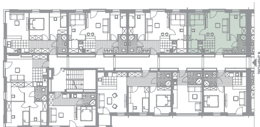
rzut II-go piętra